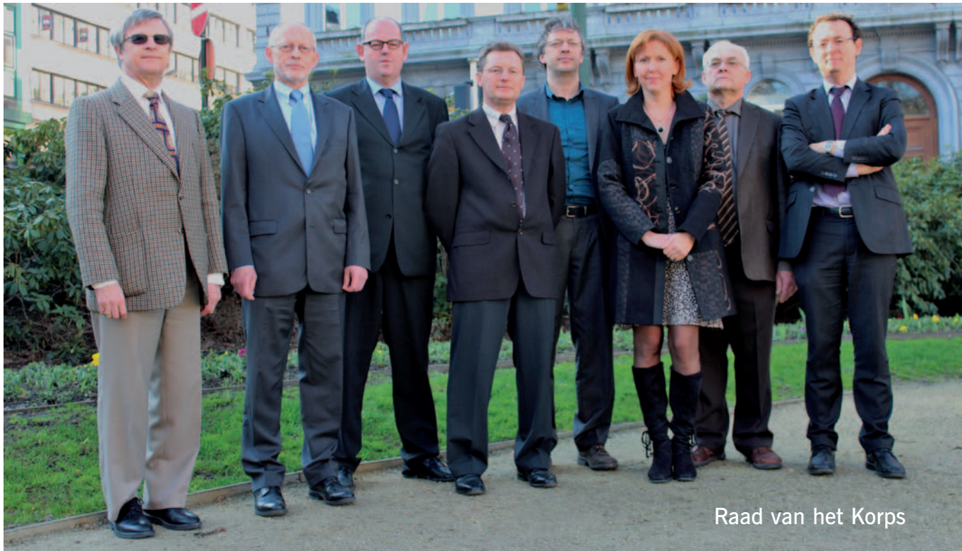
Raad van het Korps

Tijdens deze vergadering wisselen de inspecteurs van financiën ook van gedachten over actuele thema's.